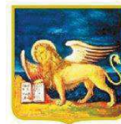
REGIONE DEL VENETO

FONDO SOCIALE EUROPEO IN SINERGIA CON IL FONDO EUROPEO DI SVILUPPO REGIONALE POR 2014 – 2020 – Ob. “Investimenti a favore della crescita e dell’occupazione”