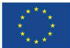
Unione europea Fondo sociale europeo