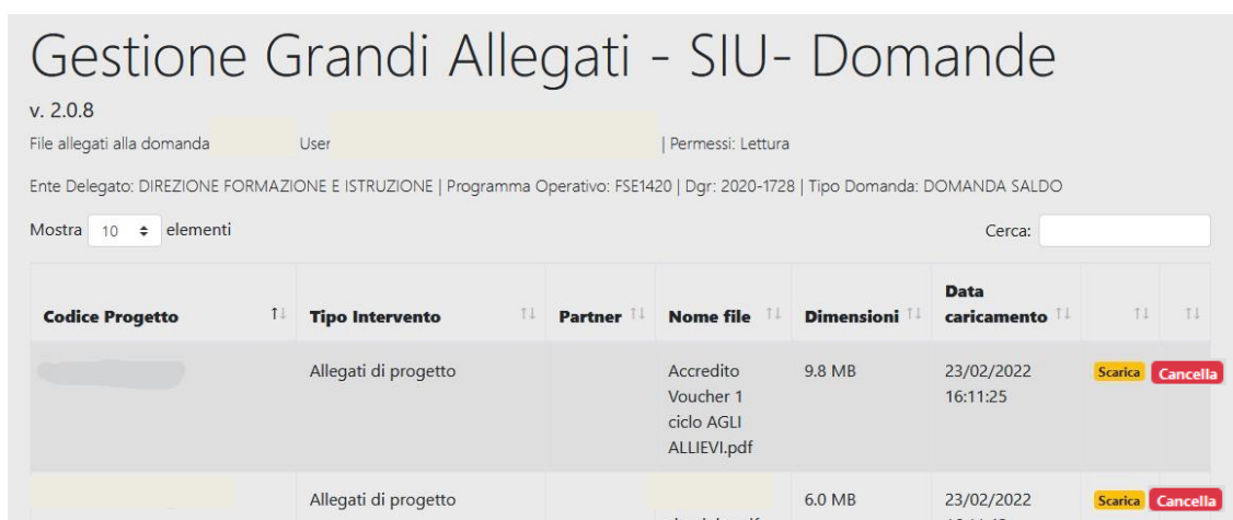
Figura 7 - Schermata GGA con file caricato

Avvenuto il caricamento, il documento viene esibito nella schermata generale dei Grandi Allegati, figura 7: