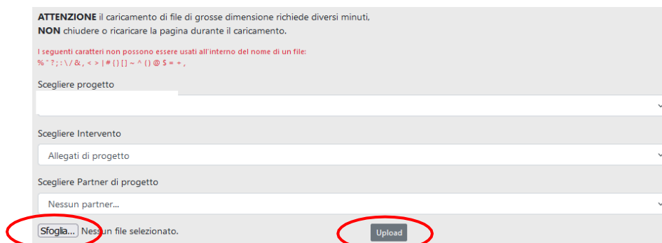
Figura 6 - Caricamento Grande Allegato

bisogna cliccare sul link in fondo alla pagina “Esegui un upload ->”. Si aprirà la seguente schermata: